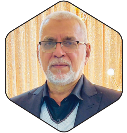
Par Bashir Nuckchady

From a spiritual point of view, travel affords us many opportunities to grow in our connection with God and in relating to God’s creatures while also having an enjoyable time. For example, if suppose you travel to a place by the sea for a holiday, you can definitely have fun swimming in the sea or making sandcastles. At the same time, you can be awestruck at the immensity of the sea or admire the beauty of the shells scattered on the beach and use these to reflect on the beauty, power and majesty of their Creator, God. If you spot a party of seagulls flying overhead, you can reflect on how God guides them across vast stretches of water and provides them food to eat. And at the end of