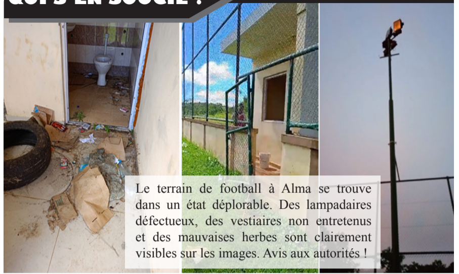
Le terrain de football à Alma se trouve dans un état déplorable. Des lampadaires défectueux, des vestiaires non entretenus et des mauvaises herbes sont clairement visibles sur les images. Avis aux autorités !