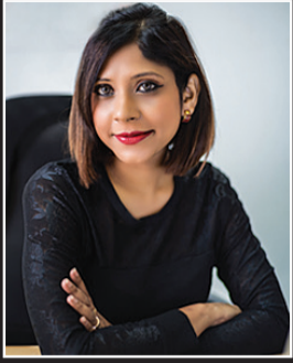
Par Zahirah RADHA Rédactrice-en-chef