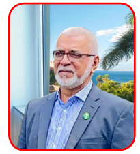
Par Bashir Nuckchady

We need now to prepare for the next five decades. we need to reinvent ourselves! This begins by thinking about a new social model and defining the appropriate directions for a new, fairer, more egalitarian society, free from the barriers imposed by the institutions Western-controlled internationals! We need more courtesy in public places, moral values, human values and religious values being taught to all level in all governmental and religious institutions. We need concrete proposals with their practical methods of application and pedagogy to explain in a simple and straightforward way what needs to be changed, how and why!